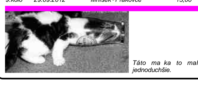
Táto ma ka to mala jednoduchoš.