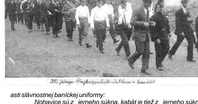
20. júl 1890. Prúďafóta, veniáš oc zástavu. - Banský 2005