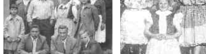
Vo Winkli v našej záhrade Valalický krok

Mnišania odpovedávali významných hostí z Valalík na železničnú stanicu. Po kalli, kým prišiel vlak, možno si dohodli ašie stretnutie... zamávali odchádzajúcim priateľom. Bolo to dávno, no spomienky a spoločné fotografie ostávajú i po uplynutí piatich desaťročí.